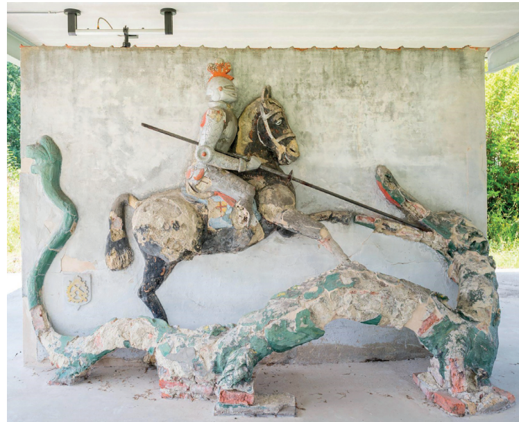
Sint-Joris en de Draak

De vakgebieden geschiedenis, mens en maatschappij staan centraal.